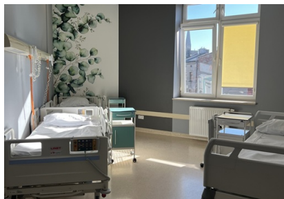
Oddział Onkologiczny, Odcinek A

Zespół nr 1 ul. Raciborska 27 40-074 Katowice