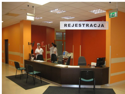
Centralna Izba Przyjęć

Zespół nr 1 ul. Raciborska 27 40-074 Katowice