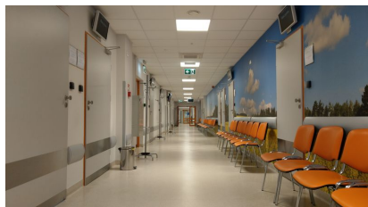
Pododdział Chemioterapii Ambulatoryjnej, Odcinek B

Zespół nr 1 ul. Raciborska 27 40-074 Katowice